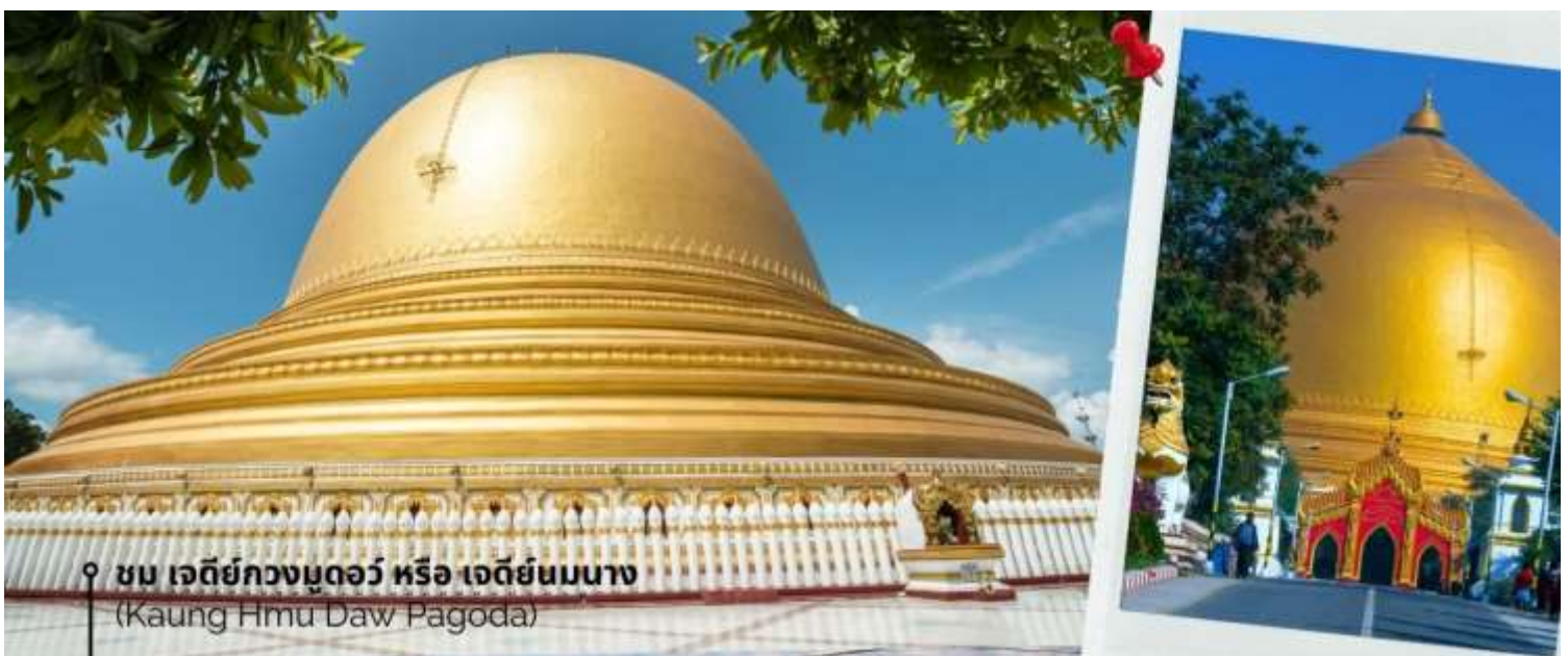
ชม เจดีย์กวงมุดอว์ หรือ เจดีย์นมนาง (Kaung Hmu Daw Pagoda)

นำท่านชม เจดีย์กวงมุดอว์ หรือ เจดีย์นมนาง (Kaung Hmu Daw Pagoda) เป็นเจดีย์พุทธขนาดใหญ่ ตั้งอยู่เขตชานเมืองทางตะวันตกเฉียงเหนือของชะไก้ โดยจำลองตามสวัณณมาลีมหาเจดีย์ ในประเทศศรีลังกา ฐานชั้นล่างสุดของเจดีย์ประดับด้วยนระและเทวดา 120 องค์ ล้อมรอบด้วยโคมหิน 802 ต้น ซึ่งแกะสลักพร้อมจารึกพุทธประวัติสามภาษาได้แก่ พม่า, มอญ และไทใหญ่ เป็นตัวแทนของสามภูมิภาคหลักสมัยอาณาจักรตองอูยุคฟื้นฟู โดมของเจดีย์ได้รับการทาสีขาวอย่างต่อเนื่อง เพื่อแสดงถึง