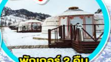
พักเกอร์ 2 คืน (มีห้องน้ำในตัว)