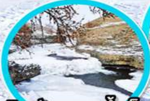
เดินเล่นบนธารน้ำแข็ง Orkhon river