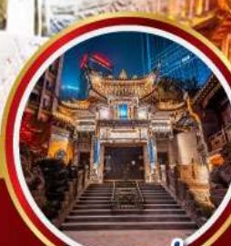
วัดหลัวอัน