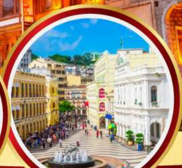
เซนาโตสแควร์