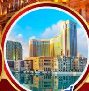
เดอะเวเนเชียน