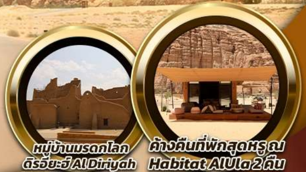
หมู่บ้านมรดกโลก ตรีชัยะวี AlDiriyah | ดำรงคืนที่พักสุดหรู ณ Habitat AlUla 2 คืน

บินหรู อยู่สบาย เที่ยวบินดี ซิลด์ ซิลด์ 10 ท่าน คอนเฟิร์มเดินทาง