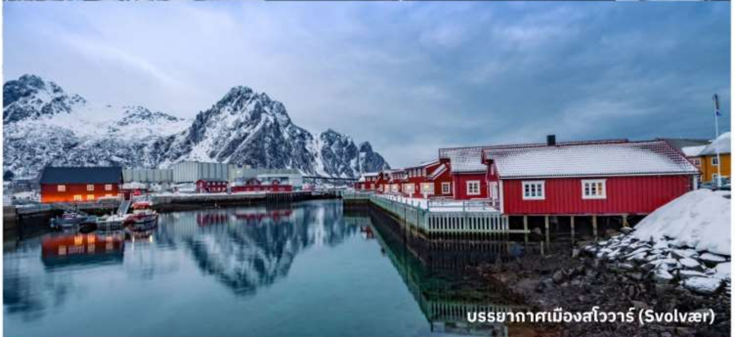
บรรยากาศเมืองสวีอาร์ (Svolvær)