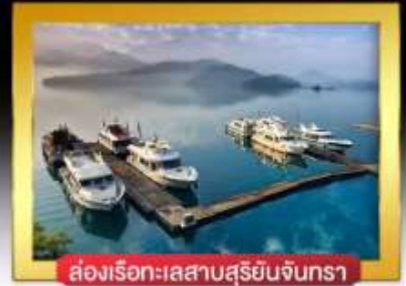
ส่องเรือทะเลสาบสุริยันจันทรา