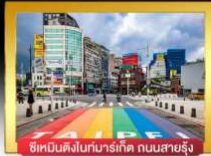
ซีเหมินติงไนท์มาร์เก็ต ถนนสายรุ้ง