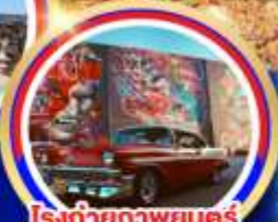
โรงถ่ายภาพยนตร์ยูนิเวอร์แซล