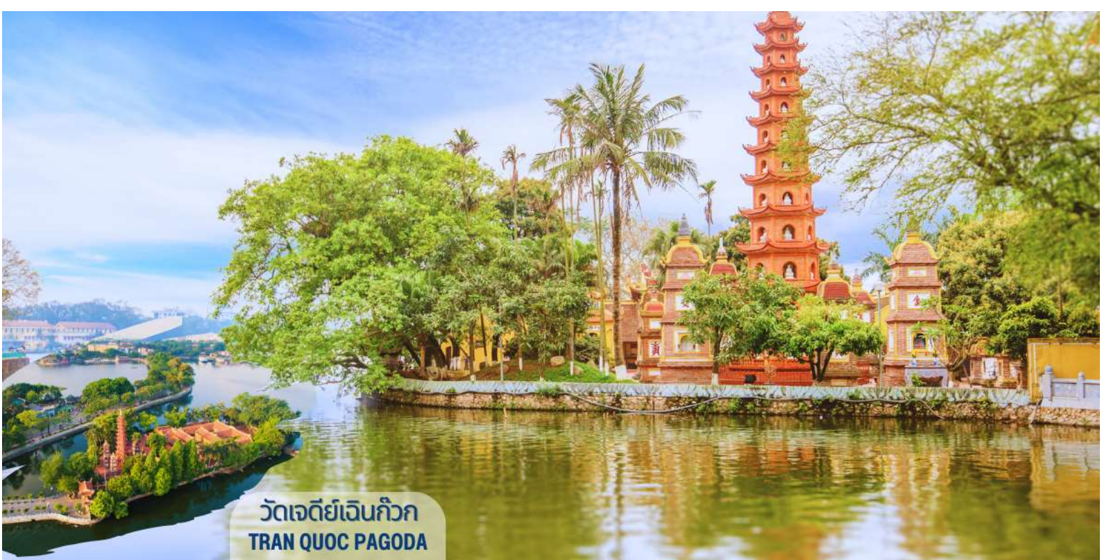
วัดเจดีย์เงินก๊วก TRAN QUOC PAGODA

นำท่านถ่ายรูปด้านหน้า สุสานโฮจิมินห์ (HO CHI MINH MAUSOLEUM) ตั้งอยู่ที่จัตุรัสบาสตงห์ เคยเป็นที่ที่ลุงโฮได้อ่านคำประกาศอิสรภาพเวียดนามจากประเทศฝรั่งเศสต่อหน้าชาวเวียดนามที่มาชุมนุมกัน เมื่อวันที่ 02 กันยายน ค.ศ.1945 สุสานนี้สร้างด้วยหินอ่อน หินแกรนิตและไม้มีค่าจากทั่วประเทศ สร้างขึ้นเมื่อปี ค.ศ. 1973 หลังจากลุงโฮเสียชีวิต เมื่อวันที่ 02 กันยายน ค.ศ.1969