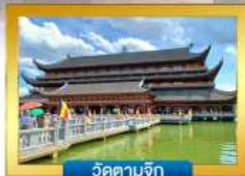
วัดตามจุก