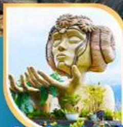
โมอาน่า ซาปา คาเฟ่