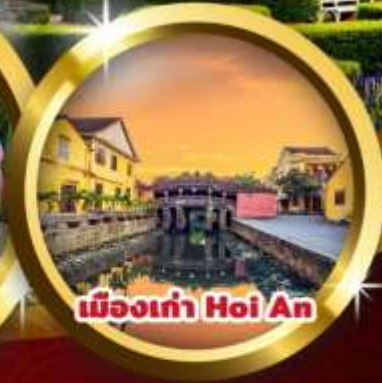
เมืองเก่า Hoi An