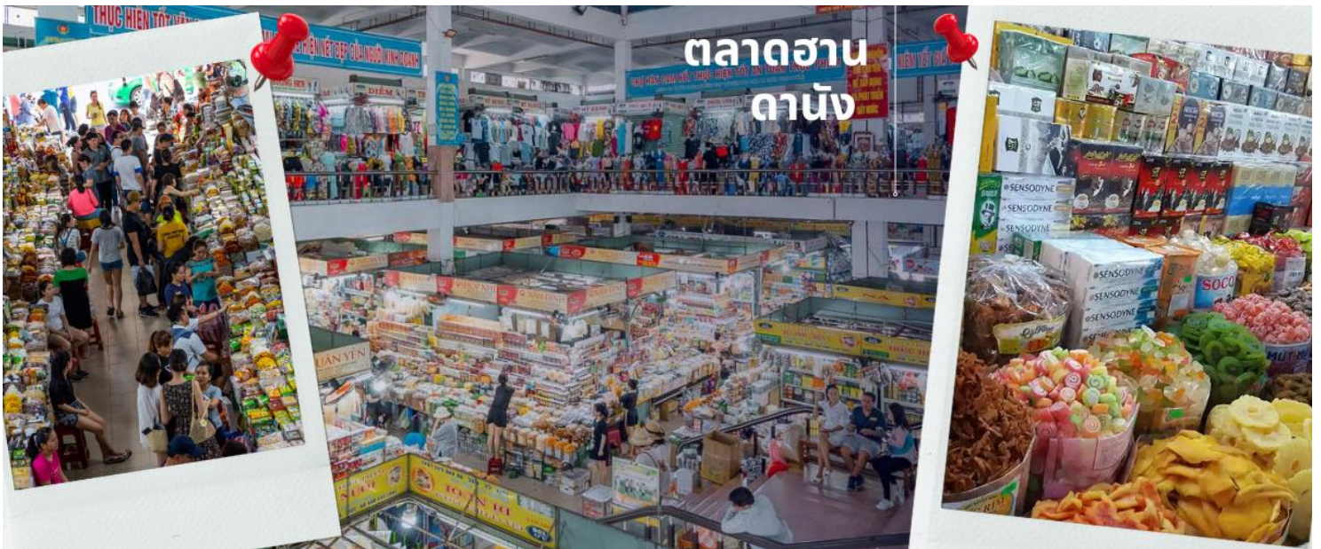
ตลาดฮาน ดานัง

นำท่านไปละลายทรัพย์ที่ ตลาดฮาน เป็นตลาดที่รวบรวมสินค้ามากมายเป็นที่นิยมทั้งชาวเวียดนามและชาวไทย อาทิ เสื้อเวียดนาม หมวก รองเท้า กระเป๋า สินค้าพื้นเมือง โดยเฉพาะงานฝีมือ อาทิ ภาพผ้าปักมืออันวิจิตร คอมพิวเตอร์ ผ้าปัก กระเป๋าปัก ตะเกียบไม้แกะสลัก ชุดอ่าวหาย่าย(ชุดประจำชาติเวียดนาม) ไว้เป็นที่ระลึกมากมายเพื่อฝากคนที่บ้าน