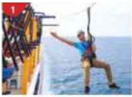
1 Ropes Course & Zipline Feel the thrill of gliding above the ocean on a 35-metre zipline.