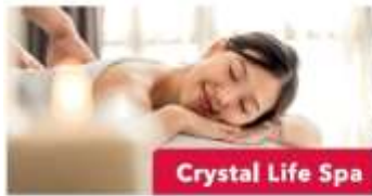
Crystal Life Spa