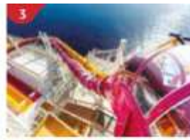
3 Waterslide Park Get drenched in fun on one of our six different waterslides.