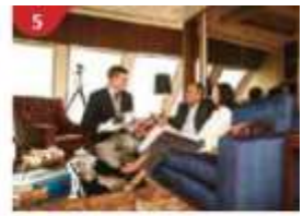
5 The Palace Indulge in European-style buffet service and exclusive facilities.