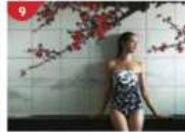
9 Crystal Life™ Spa Rejuvenate mind, body and soul with our holistic Western and Asian spa experience.