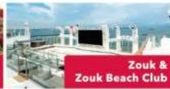
Zouk & Zouk Beach Club