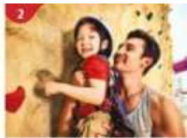
2 Rock Climbing Wall Challenge yourself on our mountainous rock climbing wall.