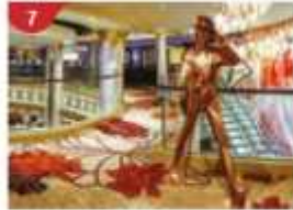
7 Johnnie Walker House™ Immerse yourself in the intricate world of premium Scotch whisky.