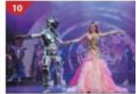
10 Zodiac Theatre Enjoy live production shows from the acclaimed award-winning entertainment team.